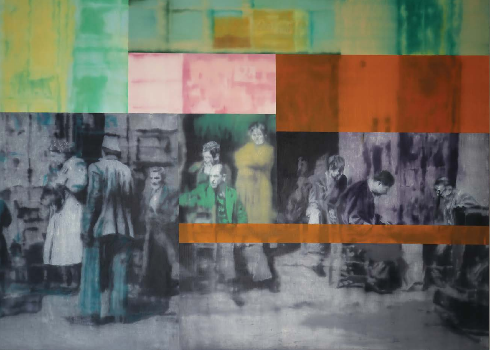
Καφενείο λάδι σε καμβά 130x180