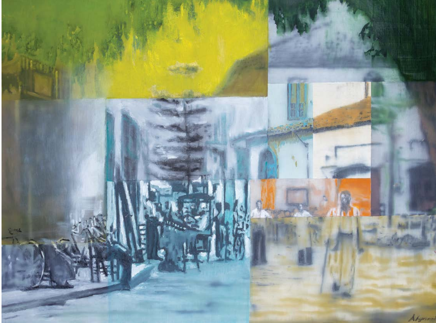
Γειτονία λάδι σε καμβά 70x90