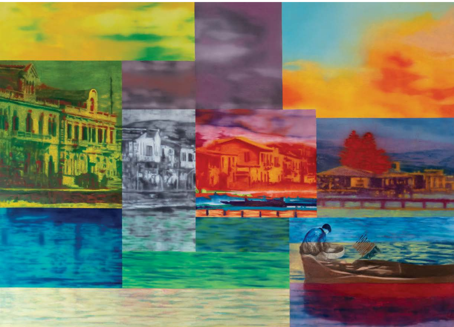
Λεμεσός, Παραλιακός λάδι σε καμβά 130x180