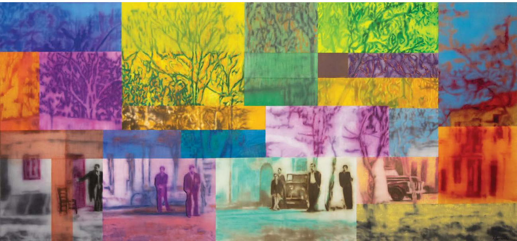
Μνήμες λάδι και παστέλ σε καμβά 130x280