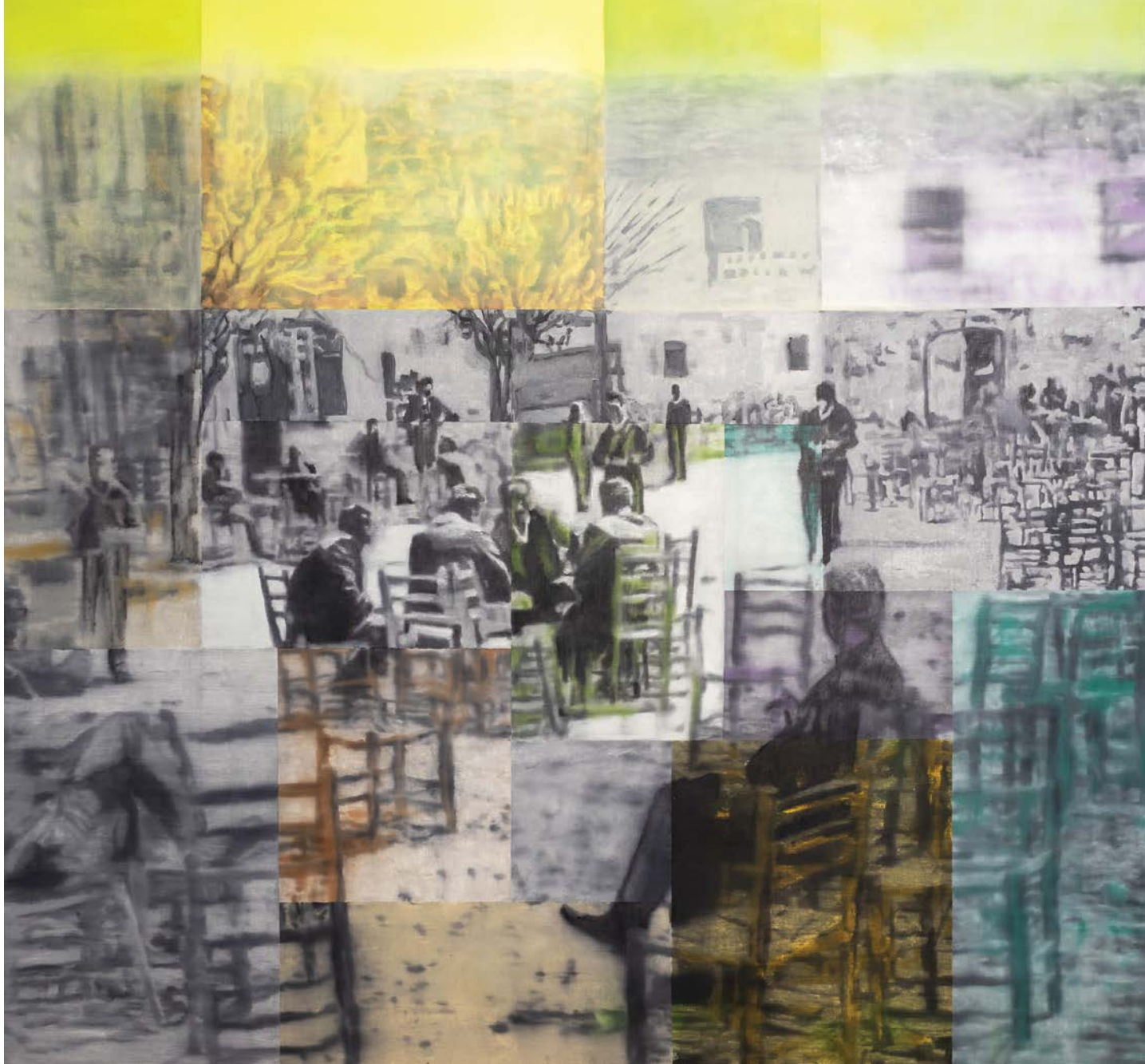
Πλατεία στα Κρασοχώρια λάδι σε καμβά 150x140