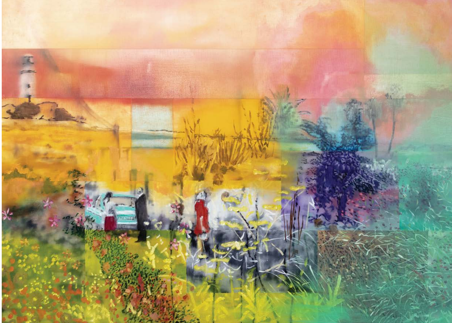
Κάτω Πάφος, Φάρος λάδι σε καμβά 80x110