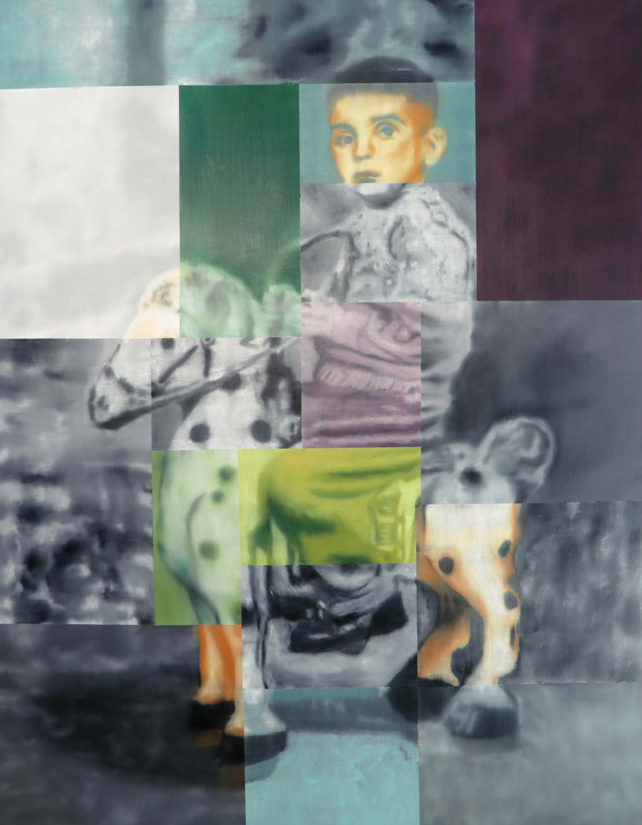
Αγόρι Αναβάτης λάδι σε καμβά 170x130