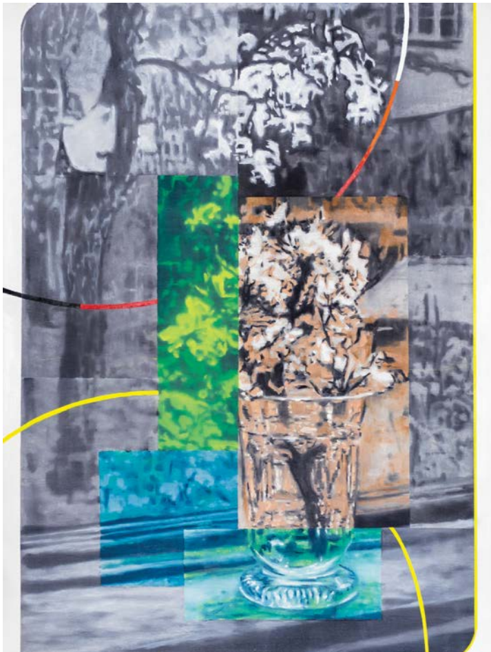
Αμυγδαλία λάδι σε καμβά 90x68