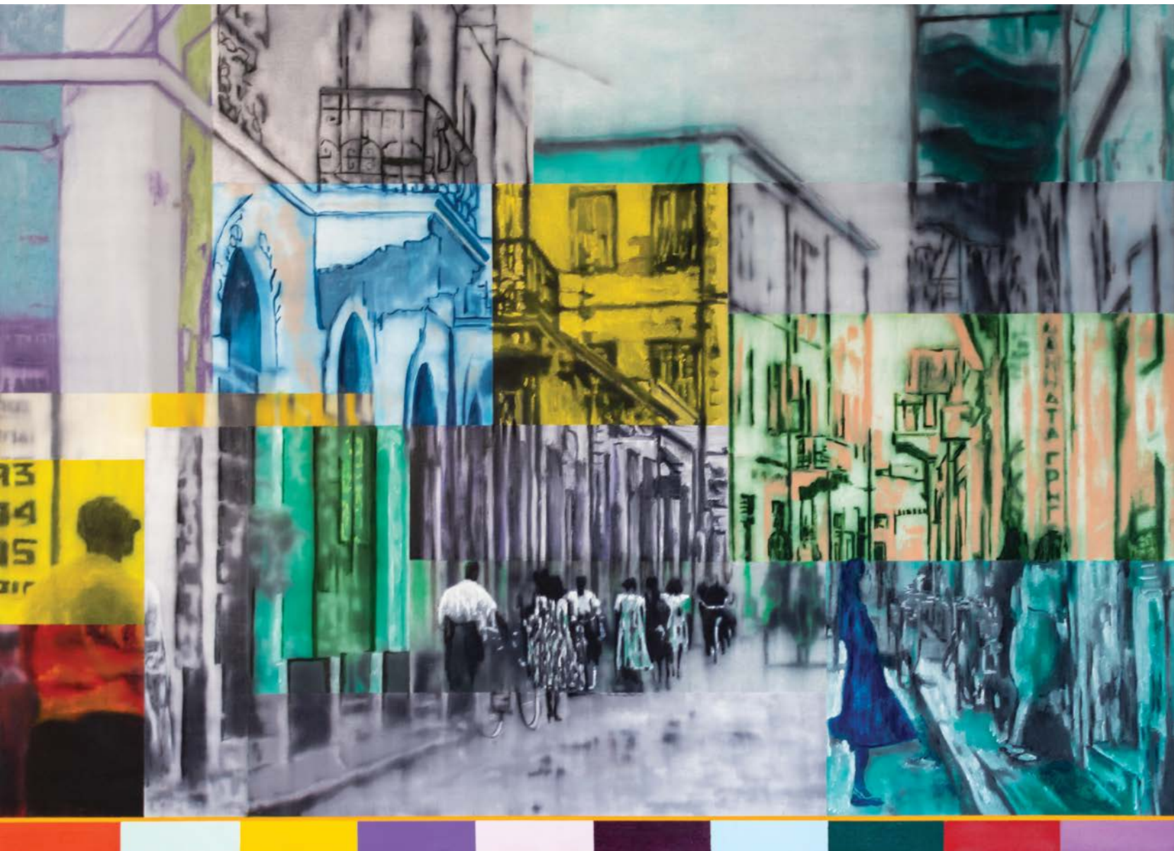
Λεμεσός, Χρωματίζοντας την Μνήμη I λάδι σε καμβά 130x180