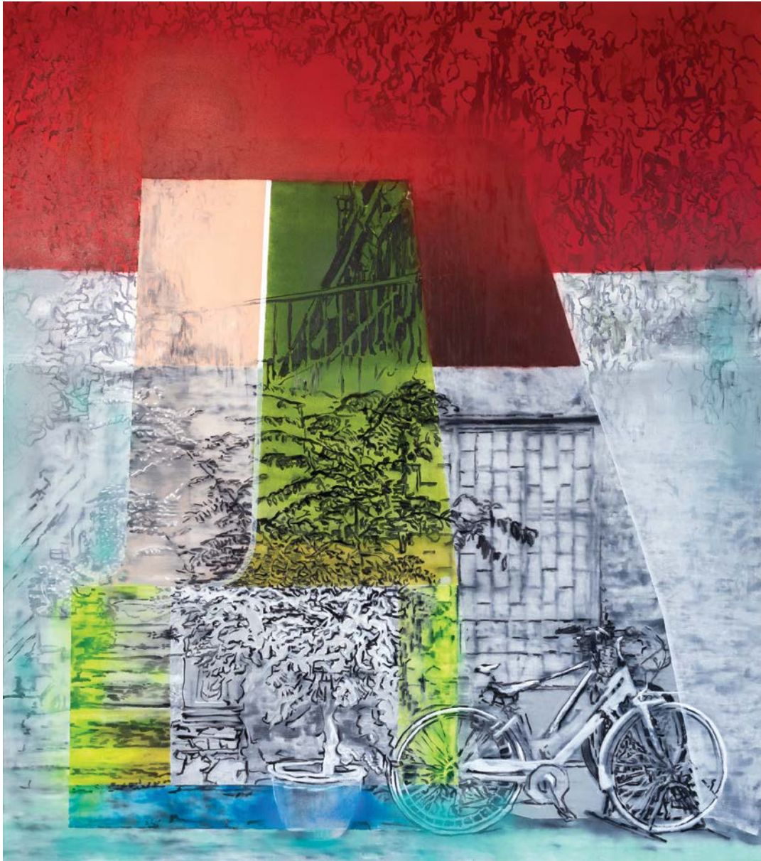
Στάση λάδι σε καμβά 150x132