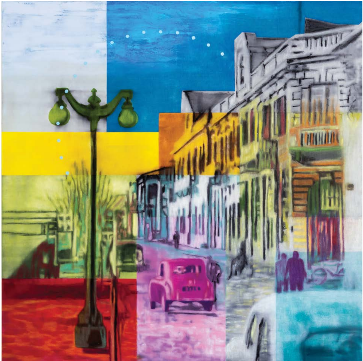
Λεμεσός, Χρωματίζοντας την Μνήμη II λάδι σε καμβά 130x130