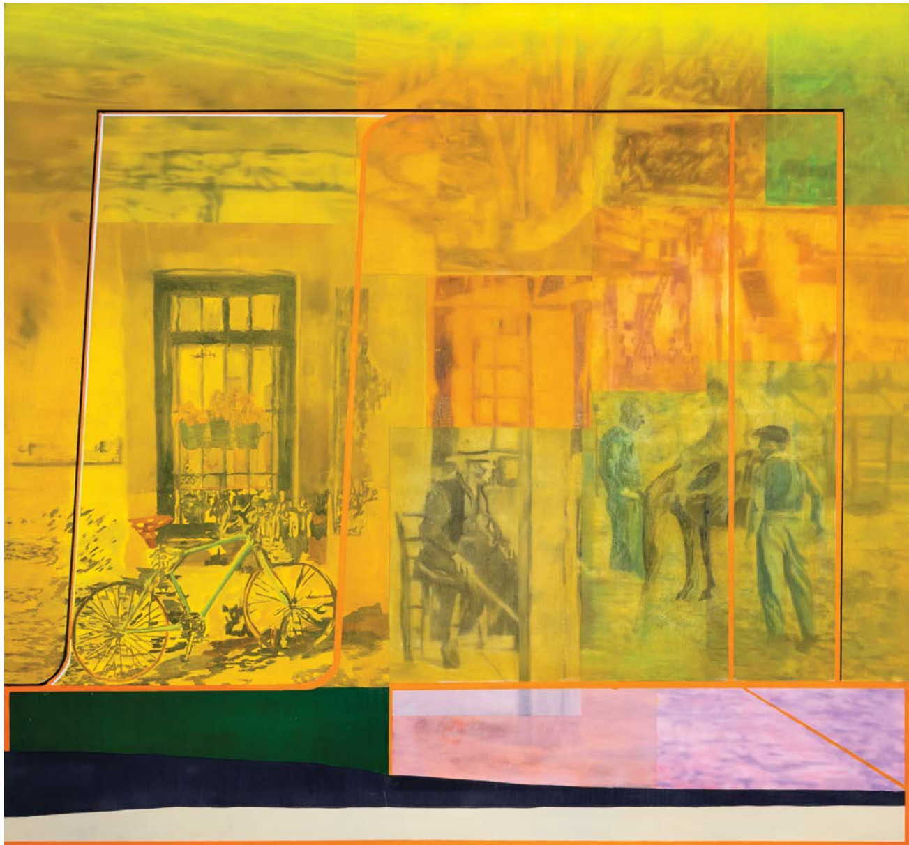
Μέσα Μεταφοράς λάδι σε καμβά 140x150