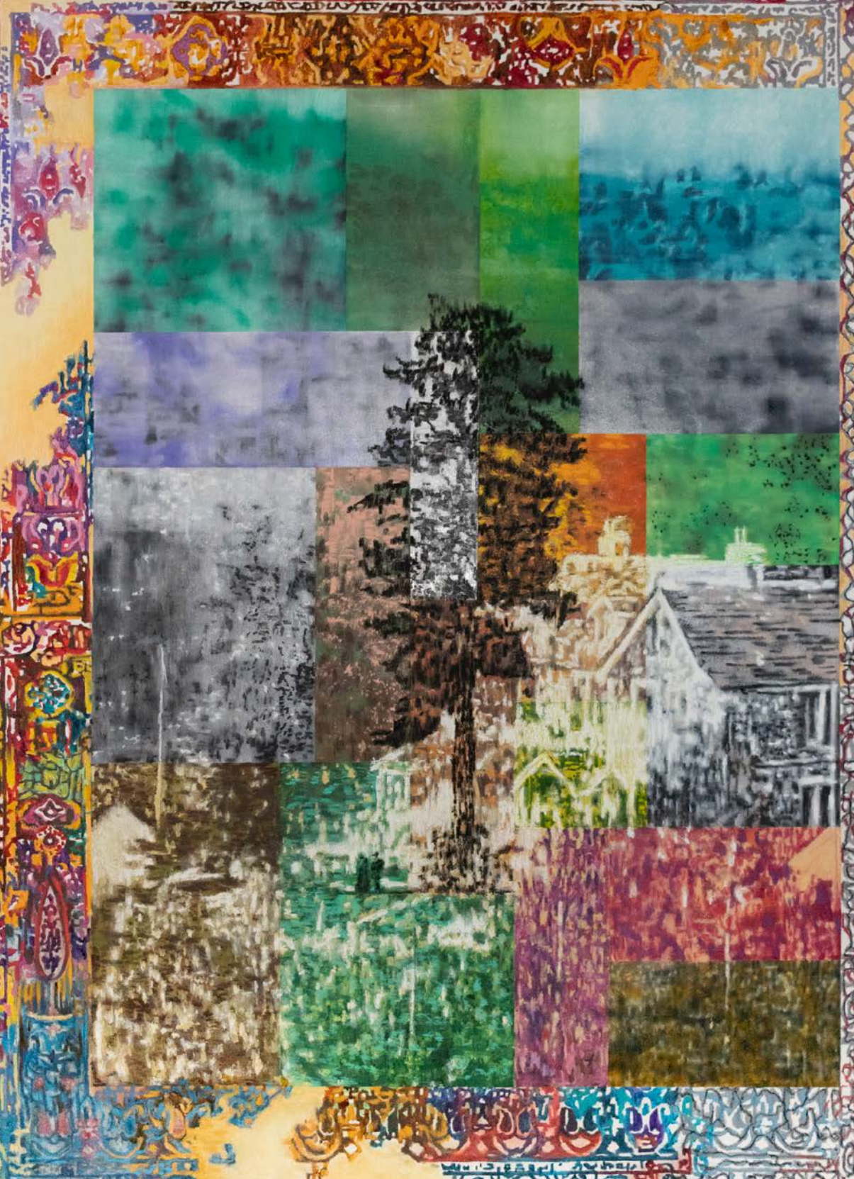
Βουνοπλαγιά στο Τρόδος λάδι και παστέλ σε καμβά 180x130